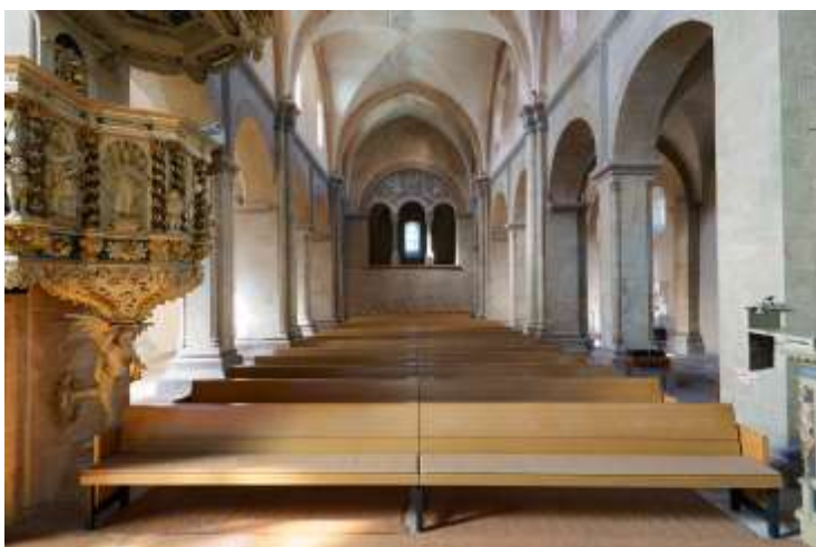
Das ist der bisherige Blick ins Hauptschiff