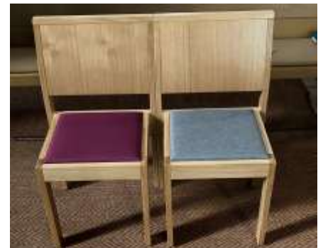
Die Polster werden eine Farbe haben

Stühle, die in Absprache mit dem Denkmalschutz ausgewählt wurden, werden sogenannte Bankstühle sein – in einer Reihe gestellt ergibt sich fast die Optik einer geschlossenen Kirchenbank, aber eben mit